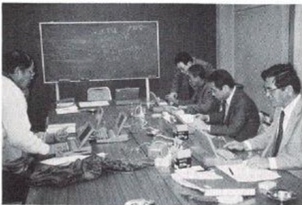
仲間に教えられ真剣にPCをつつく

PC歴の古いメンバーが交替で指導し、出席率は70%程度で、メンバーの平均年齢は50を越えておる。（ハーフのスコアでも偏差値でもありません）