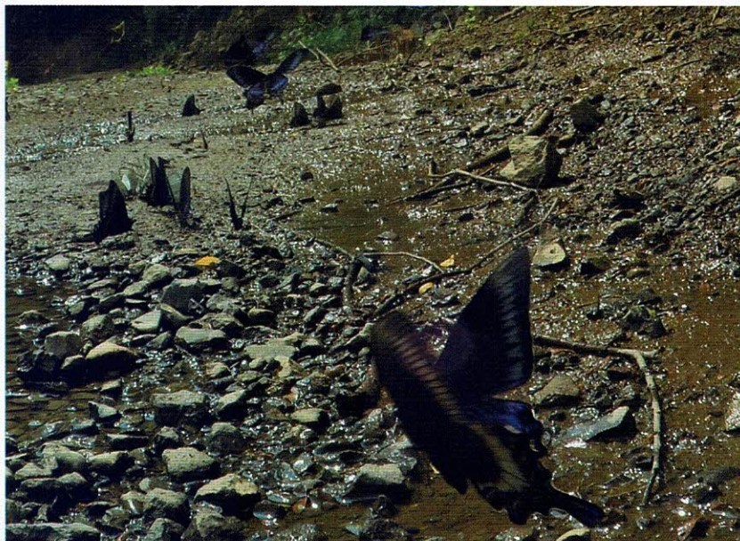
ミヤマカラスアゲハ

【発行日】 2017年 6月 30日 【編集】 PR・IT委員会 【発行者】 蒲郡マリンライオンズクラブ (蒲郡商工会議所 3F) TEL(0533)68-1100 FAX(0533)69-2200 【印刷】 (株) サンジュ堂印刷 蒲郡市三谷町六舗 21 番地 TEL(0533)68-2265